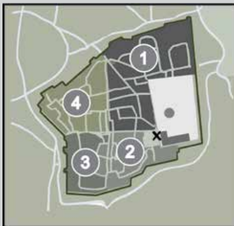
Ryc. 2. Stara Jerozolima i Wzgórze Świątynne. Dzielnice to odpowiednio: 1 – muzułmańska, 2 – żydowska. 3 – ormiańska, 4 – chrześcijańska. Na wzgórzu: Kopała na Skale (okrągły) oraz Al-Aksa. ‚X‘ – Ściana Płaczu.

Druga Świątynia przetrwała do I w. n.e. Zburzyli ją Rzymianie w czasie pierwszego powstania żydowskiego w 70 roku. Pozostał po niej fragment zachodniego muru, znany jako Ściana Płaczu. Wedle wykładni religijnych dopiero odbudowanie świątyni pozwoli na przyjście na świat Zbawiciela.